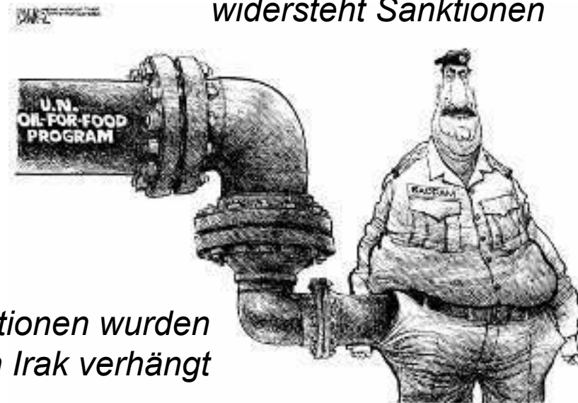
Wirtschaftliche Sanktionen wurden 1990 gegen den Irak verhängt