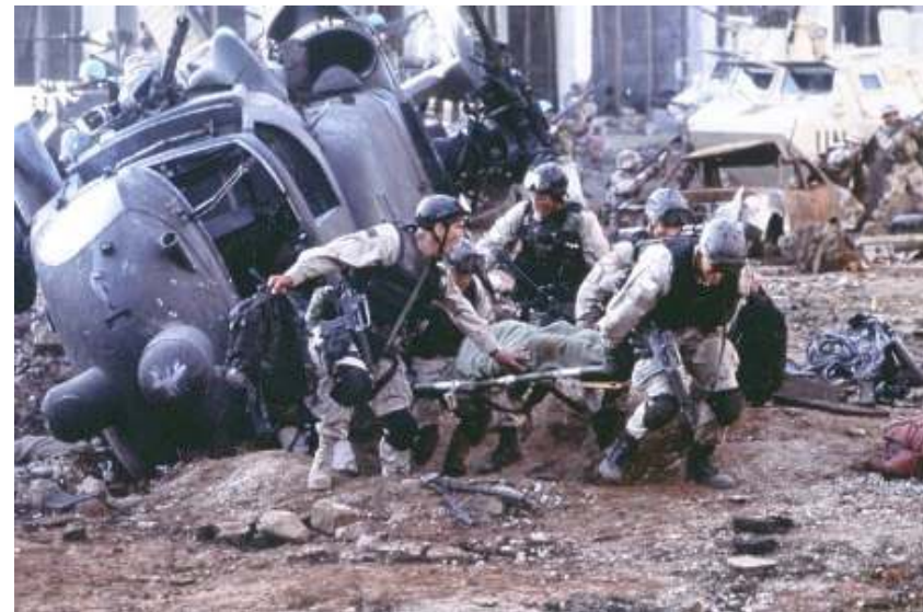
Szene aus dem Film „Black Hawk Down“