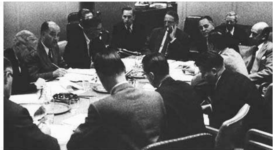
Organizing the first peacekeeping force, the UN Emergency Force; November, 1956