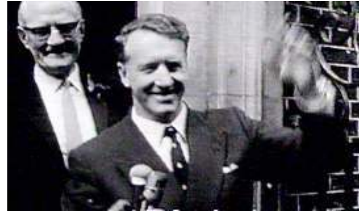
Ian Smiths Rhodesien widersteht Sanktionen