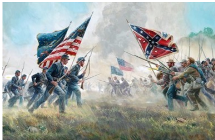
Amerikanischer Bürgerkrieg 1861-1865