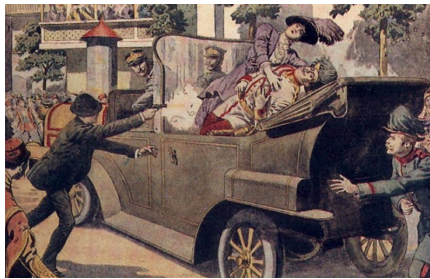
Das Attentat von Sarajevo (28.6.1914)