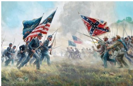
Amerikanischer Bürgerkrieg 1861-1865