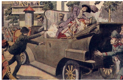
Das Attentat von Sarajevo (28.6.1914)